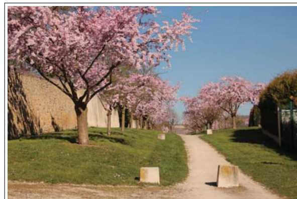
Verger du Quartier Saint-Pierre