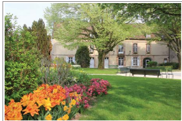
Jardin de l'Hôtel de Ville