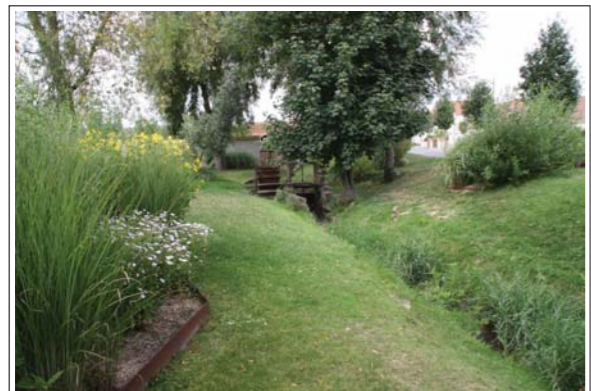
Domaine des Saules