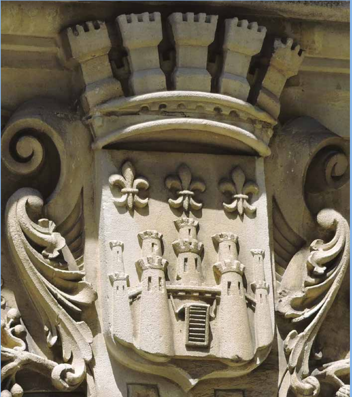
Réponse : ce sont les armoiries de Sézanne, qui se trouvent au-dessus de l'entrée de l'école maternelle du Centre, rue de l'Hôtel de Ville