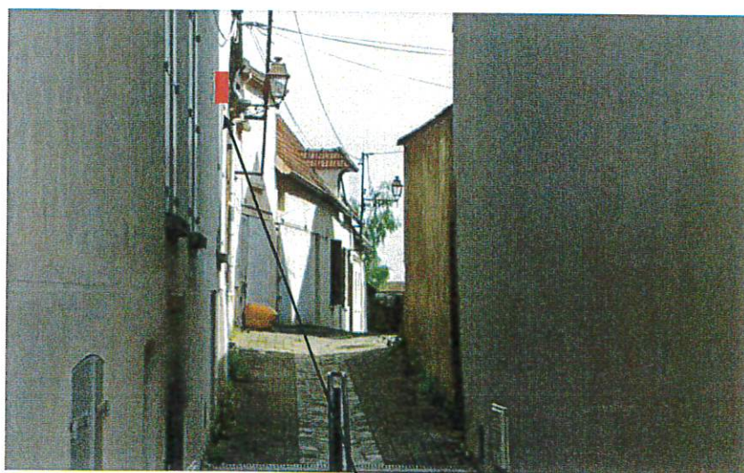
Position future boîte